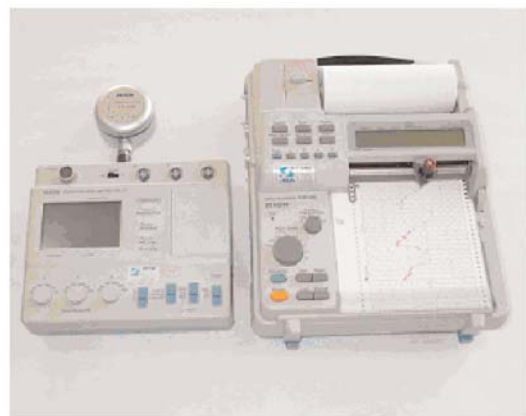
(b) 振動レベル計とレベルレコーダ