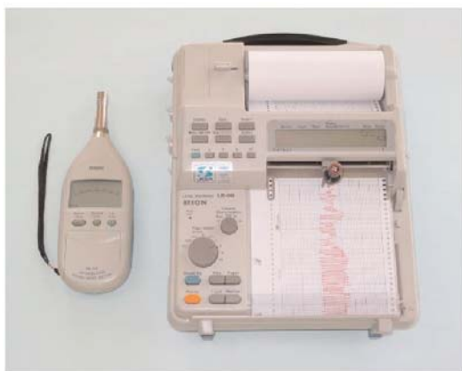
(a) 普通騒音計とレベルレコーダ